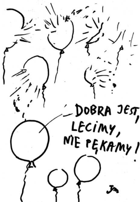
Rys. Stanisław Tym